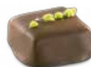
Praliné Pistache Fourré au praliné amande et décoré de pistaches bio de Sicile