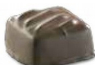
Ganache St Domingo Ganache noire onctueuse au cacao de Saint Domingue