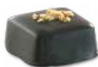
Carré Brésilienne Crème caramel maison garnie à la brésilienne