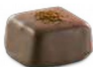
Moka Colombia Onctueuse crème moka au café de Colombie