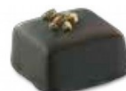
Brut de Noir Délicatesse noir intense 70% au praliné noisette et décoré de brisures de fèves de cacao d'Équateur

Avec cet assortiment vos sens vous feront voyager dans toute l'Amérique Latine. Du cacao péruvien, dominicain, en passant par l'Équateur ou la Colombie, la richesse de ce ballotin satisfera les palets des plus gourmets d'entre vous !